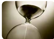
은혜의 시간이 끝나는 때