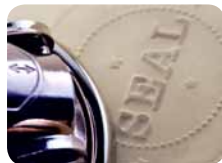
계명을 지키는 성품

또 보매 다른 천사가 살아계신 하나님의 인을 가지고 해 돋는 데로부터 올라와서 땅과 바다를 해롭게 할 권세를 얻은 네 천사를 향하여 큰 소리로 외쳐 가로되 우리가 우리 하나님의 종들의 이마에 인치기까지 땅이나 바다나 나무나 해하지 말라 하더라 (계 7:2~3)